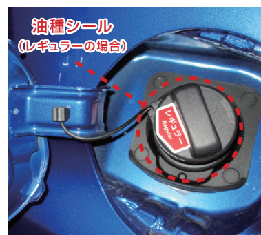
給油口のシールで油種をご確認ください (レギュラー・ハイオク・軽油のいずれか)

*1給油代行手数料について: 燃料を満タンで返却されなかった場合、弊社で給油代行をおこない、下記算出基準の単価に手数料を含めた金額を請求します。 [燃料単価基準] 燃料単価1リットルあたり=(石油情報センター平均単価※)+10円(給油代行手数料) ※離島は別料金体系となります※変動相場あり [車種別走行1km/円単価算出基準] 走行1kmあたり単価=燃料単価÷(自動車燃費車種別燃費値[国土交通省算出]×0.7[当社基準係数])